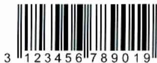
2D тест штрих-кода